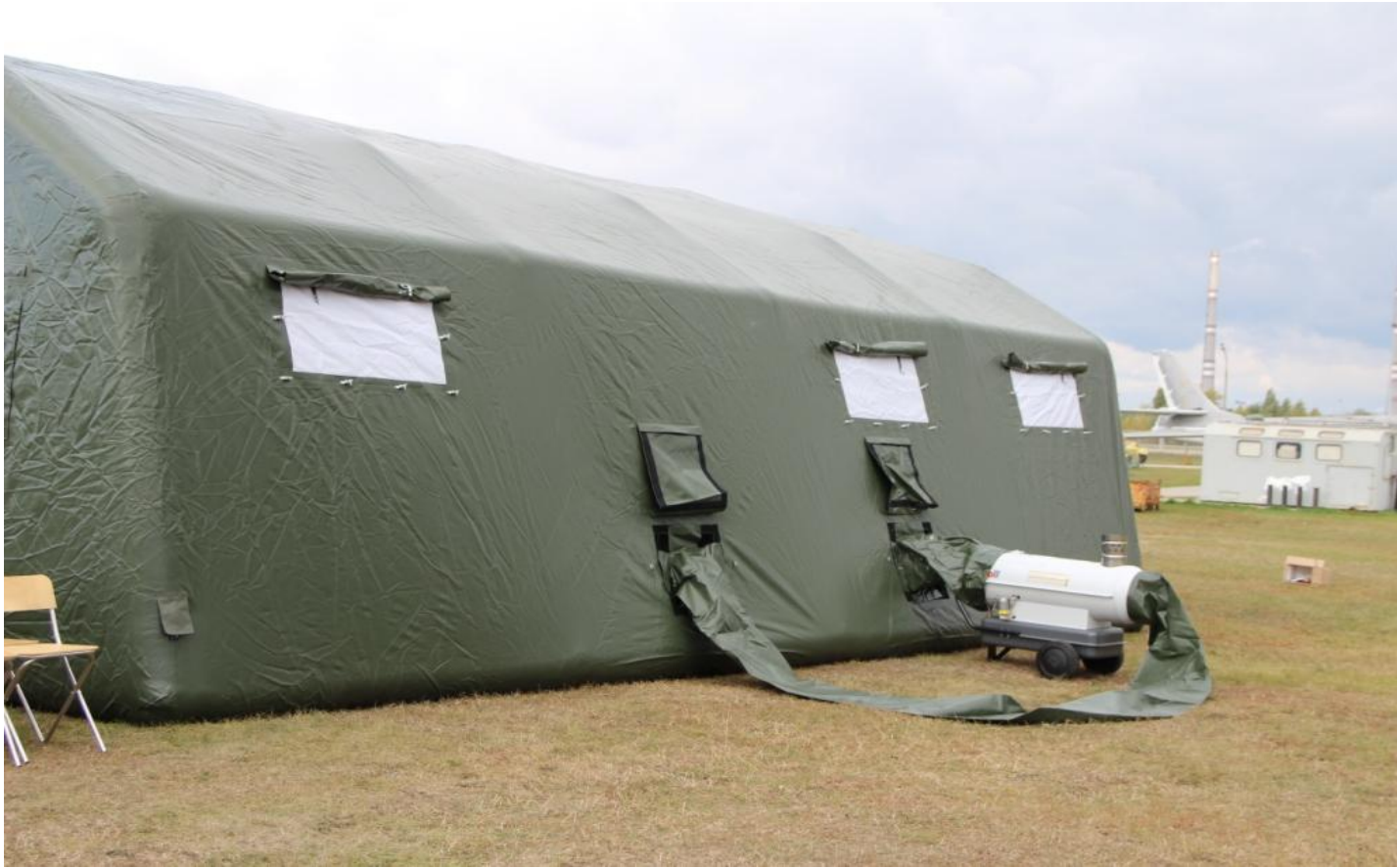
Система обогрева жилого модуля