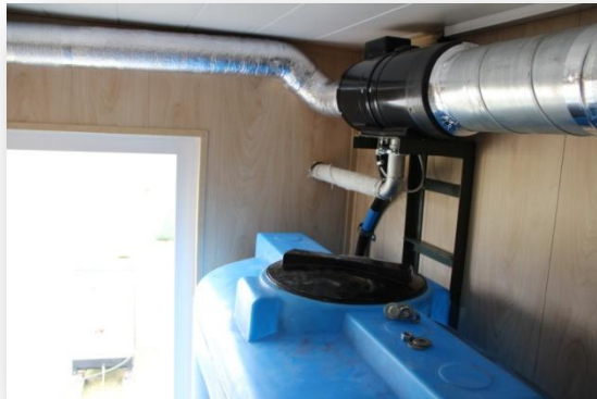
Бак для воды и система пожаротушения